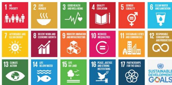
The Global Sustainable Development Goals (SDGs) 2030 Agenda 1

מודלים לשילוב החברה האזרחית בקידום היעדים העולמיים לפיתוח בת קיימא עד שנת 2030